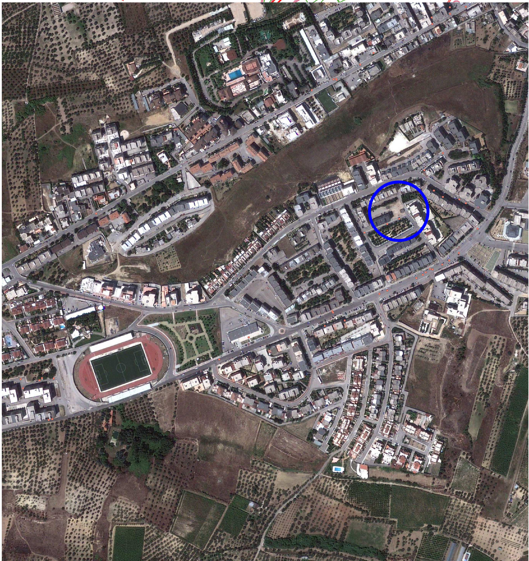
01 Individuazione area PIRP e area di intervento scala 1:5.000